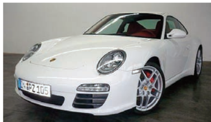
8 Porsche 911 Carrera 4S Nachtblaumetallic EZ 04/2010 | 15.000 km | EUR 93.800*