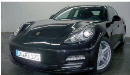
10 Porsche Panamera 4 Basaltschwarzmetallic EZ 09/2010 | 8.000 km | EUR 94.800*