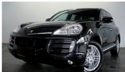
11 Porsche Cayenne S mit Tiptronic Basaltschwarzmetallic EZ 03/2007 | 45.000 km | EUR 42.500*