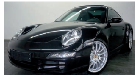
9 Porsche 911 Targa 4 Basaltschwarzmetallic EZ 11/2007 | 33.500 km | EUR 64.800*