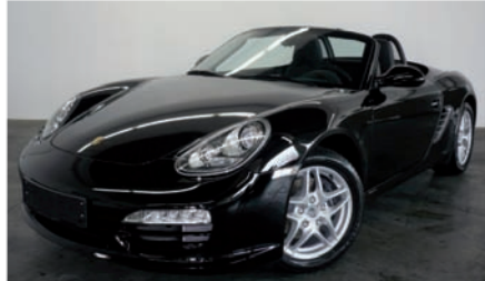
2 Porsche Boxster Schwarz EZ 09/2010 | 10.000 km | EUR 47.800*