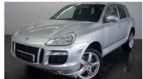
12 Porsche Cayenne Turbo Kristallsilbermetallic EZ 08/2005 | 100.200 km | EUR 36.800*