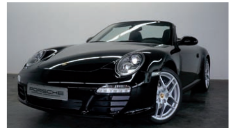
6 Porsche 911 Carrera Cabriolet Schwarz EZ 06/2010 | 8.000 km | EUR 94.800