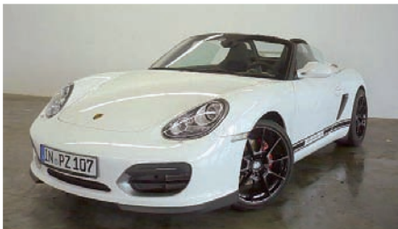
4 Porsche Boxster Spyder Carraraweiß EZ 04/2010 | 8.000 km | EUR 66.300*