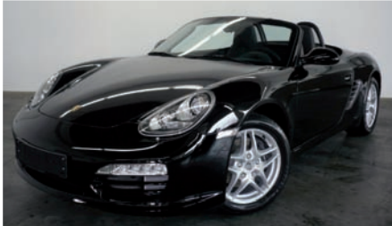
1 Porsche Boxster Schwarz EZ 05/2010 | 8.000 km | EUR 42.800*

Weitere tagesaktuelle Angebote finden Sie unter www.porsche-ingolstadt.de .