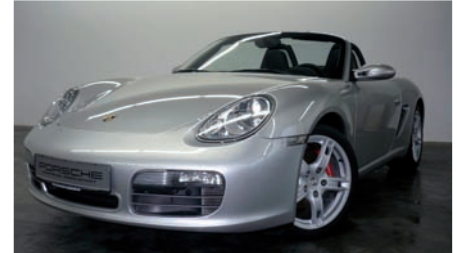
3 Porsche Boxster S Arktissilbermetallic EZ 11/2005 | 63.500 km | EUR 29.800*