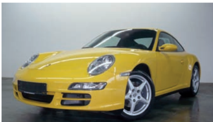
7 Porsche 911 Carrera 4 Speedgelb 05/2005 | 69.650 km | EUR 49.800*