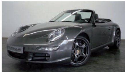
5 Porsche 911 Carrera Cabriolet Schiefermetallic EZ 04/2006 | 72.000 km | EUR 54.750*