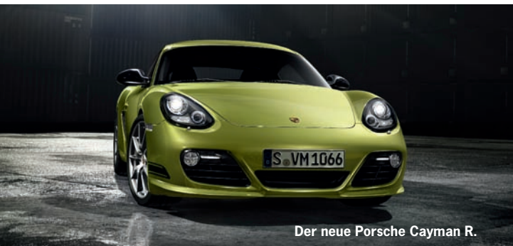
Der neue Porsche Cayman R.