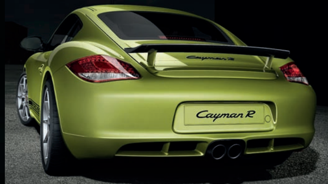
Cayman R mit PDK Verbrauch/Emissionen: Innerstädtisch in l/100 km 14,0 · Außerstädtisch in l/100 km 6,6 · Gesamt in l/100 km 9,3 · CO 2 -Emissionen in g/km 218