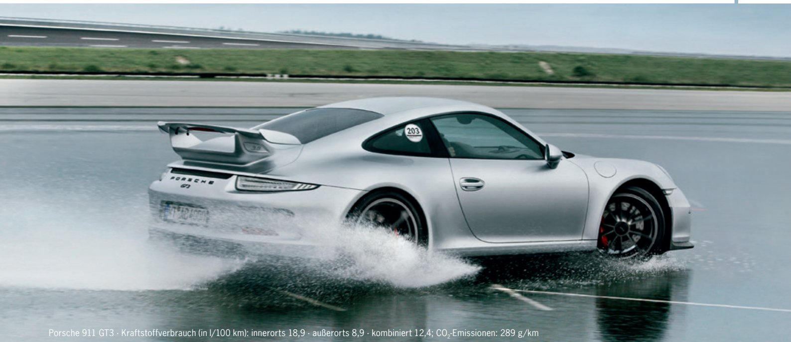
Porsche 911 GT3 · Kraftstoffverbrauch (in l/100 km): innerorts 18,9 · außerorts 8,9 · kombiniert 12,4; CO 2 -Emissionen: 289 g/km

mit Hand und Fuß. Und das ohne die Hilfe elektronischer Assistenzsysteme.