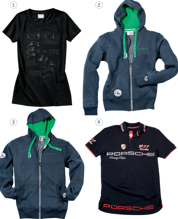
Wappen T-Shirt Damen schwarz, S-L WAP 797 XXX OE | EUR 45,-