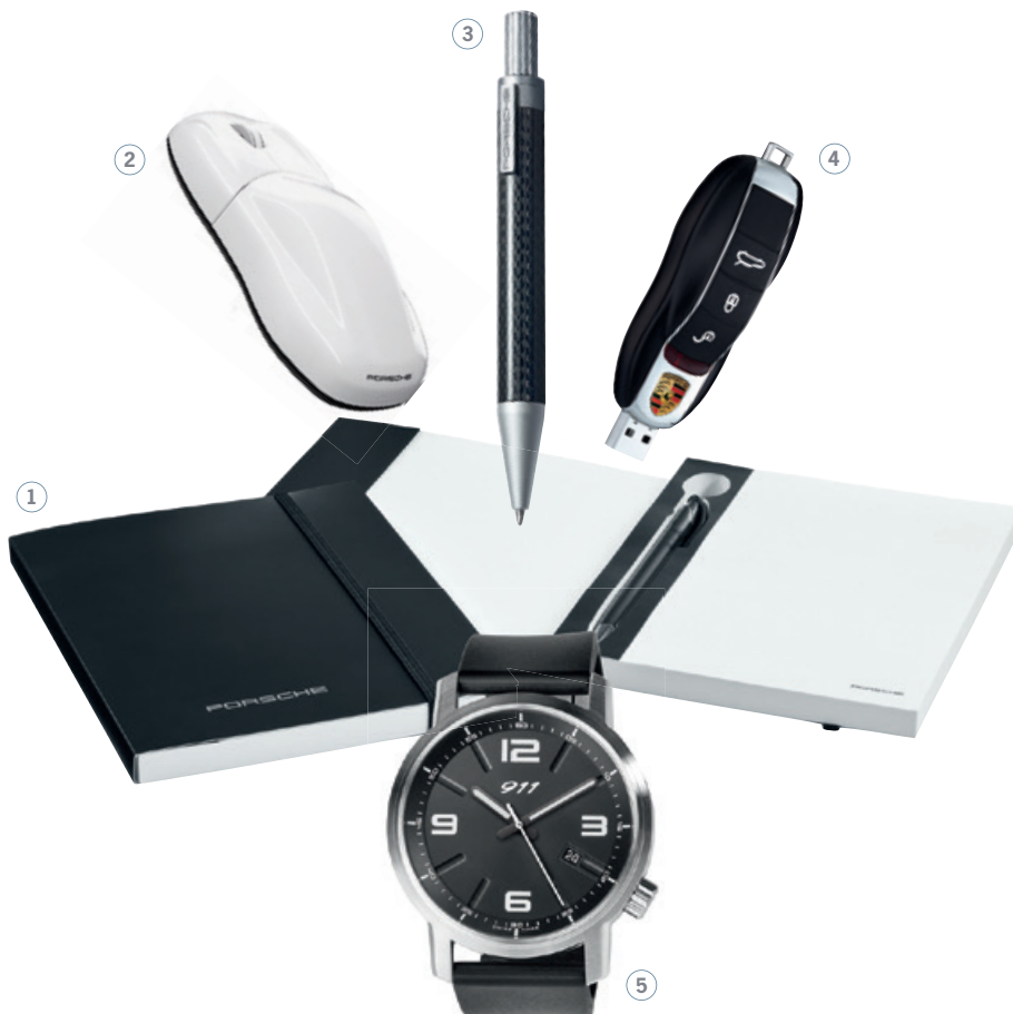
Notizbuch klassisch, schwarz WAP 092 005 OD | EUR 19,-