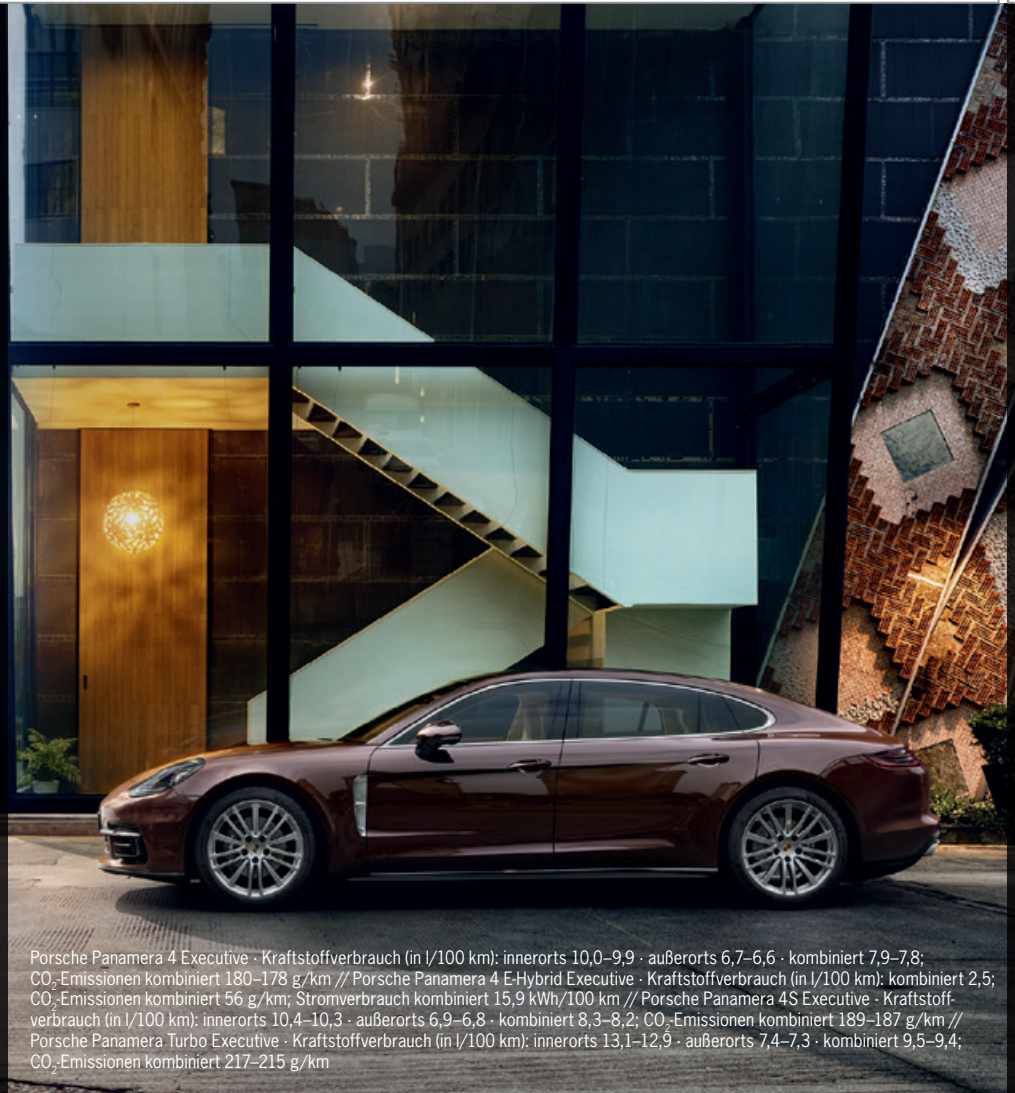
Porsche Panamera 4 Executive · Kraftstoffverbrauch (in l/100 km): innerorts 10,0–9,9 · außerorts 6,7–6,6 · kombiniert 7,9–7,8; CO 2 -Emissionen kombiniert 180–178 g/km // Porsche Panamera 4 E-Hybrid Executive · Kraftstoffverbrauch (in l/100 km): kombiniert 2,5; CO 2 -Emissionen kombiniert 56 g/km; Stromverbrauch kombiniert 15,9 kWh/100 km // Porsche Panamera 4S Executive · Kraftstoffverbrauch (in l/100 km): innerorts 10,4–10,3 · außerorts 6,9–6,8 · kombiniert 8,3–8,2; CO 2 -Emissionen kombiniert 189–187 g/km // Porsche Panamera Turbo Executive · Kraftstoffverbrauch (in l/100 km): innerorts 13,1–12,9 · außerorts 7,4–7,3 · kombiniert 9,5–9,4; CO 2 -Emissionen kombiniert 217–215 g/km

Der Panamera 4S Executive und der Panamera Turbo Executive sind zusätzlich mit Hinterachslenkung, dem ParkAssistenten inklusive Rückfahrkamera sowie Soft-Close-Türen ausgestattet. Ebenfalls serienmäßig beim Panamera Turbo Executive: die 4-Zonen-Klimaanlage.