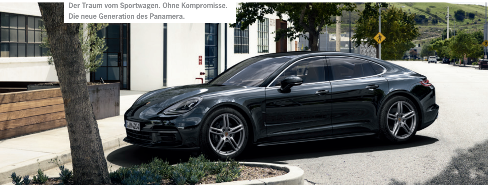
Der Traum vom Sportwagen. Ohne Kompromisse. Die neue Generation des Panamera.

Porsche 911 Turbo Modelle - Kraftstoffverbrauch (in l/100 km): innerorts 12,1–11,8 · außerorts 7,6–7,5 · kombiniert 9,3–9,1; CO 2 -Emissionen kombiniert 216–212 g/km