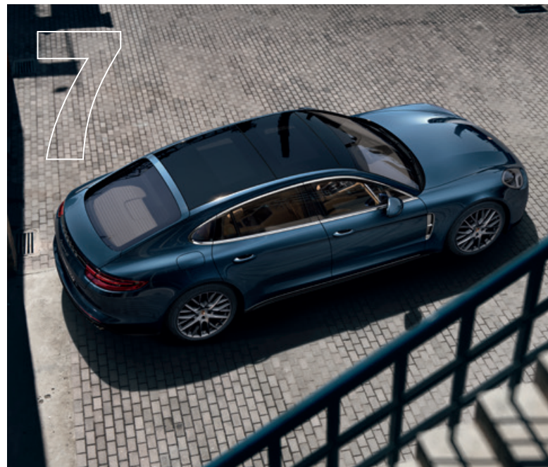
Mehr Raum für unvergleichliches Fahrvergnügen. Die neuen Panamera Executive Modelle.