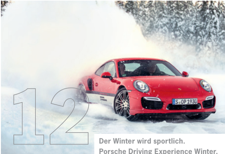
Der Winter wird sportlich. Porsche Driving Experience Winter.