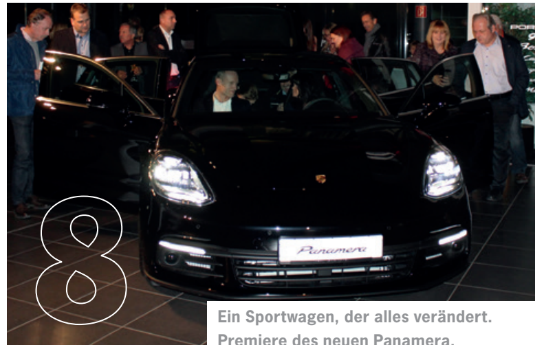
Ein Sportwagen, der alles verändert. Premiere des neuen Panamera.