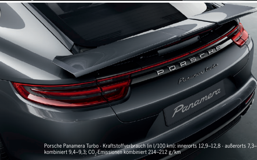
Porsche Panamera Turbo · Kraftstoffverbrauch (in l/100 km): innerorts 12,9–12,8 · außerorts 7,3–7,2 · kombiniert 9,4–9,3; CO 2 -Emissionen kombiniert 214–212 g/km