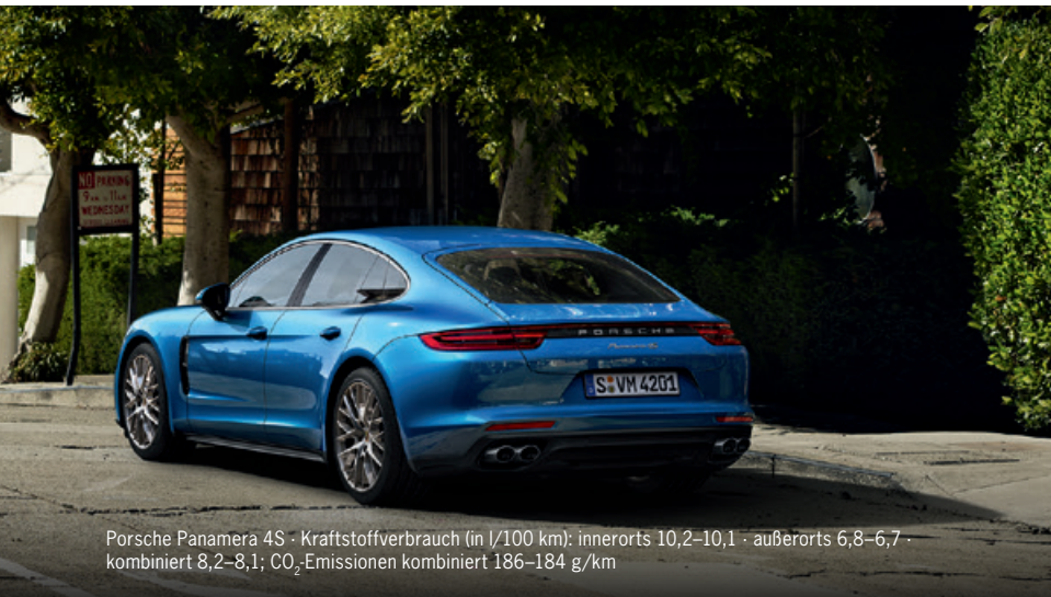
Porsche Panamera 4S · Kraftstoffverbrauch (in l/100 km): innerorts 10,2–10,1 · außerorts 6,8–6,7 · kombiniert 8,2–8,1; CO 2 -Emissionen kombiniert 186–184 g/km

Die neue Generation des Panamera ist mit sechs Modellen für jede Straßen- und Lebenslage bestens aufgestellt. Hinzu kommen vier neue Panamera Executive Modelle mit verlängerter Karosserie – für zusätzlichen Raum beim Arbeiten oder Entspannen im Fond. Ganz gleich, für welches Modell Sie sich auch entscheiden: Der neue Panamera ist der fahrende Beweis, dass Sportlichkeit und Komfort keine Gegensätze sein müssen – und dass es sich lohnt, Mut zu Veränderung zu beweisen.