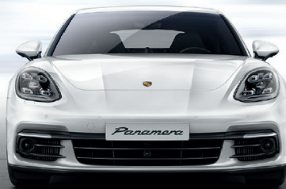
Porsche Panamera 4 E-Hybrid · Kraftstoffverbrauch (in l/100 km): kombiniert 2,5; CO 2 -Emissionen kombiniert 56 g/km; Stromverbrauch kombiniert 15,9 kWh/100 km

Entscheidend für die Performance des Hybrid-Antriebskonzepts des Panamera 4 E-Hybrid ist die Kombination aus Verbrennungsmotor und elektrischer Maschine. Die Systemleistung von 340 kW (462 PS) erzeugt der Verbund aus 2,9-Liter-V6-Biturbo-Motor mit 243 kW (330 PS) und elektrischer Maschine mit 100 kW (136 PS). Damit beschleunigt der neue Panamera 4 E-Hybrid in 4,6 Sekunden von 0 auf 100 km/h. Ebenso überzeugend: der geringe Verbrauch von nur 2,5 l/100 km.