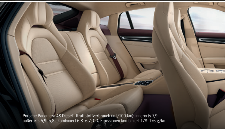
Porsche Panamera 4S Diesel · Kraftstoffverbrauch (in l/100 km): innerorts 7,9 · außerorts 5,9–5,8 · kombiniert 6,8–6,7; CO 2 -Emissionen kombiniert 178–176 g/km