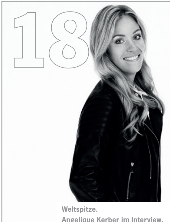
Weltspitze. Angelique Kerber im Interview.