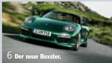
6 Der neue Boxster.