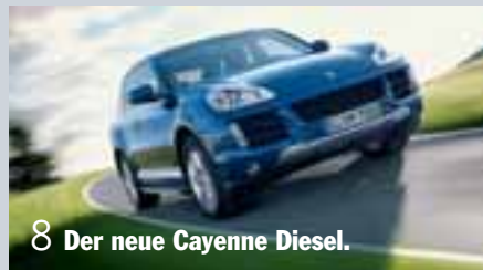
8 Der neue Cayenne Diesel.