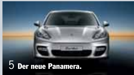
5 Der neue Panamera.