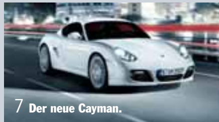
7 Der neue Cayman.